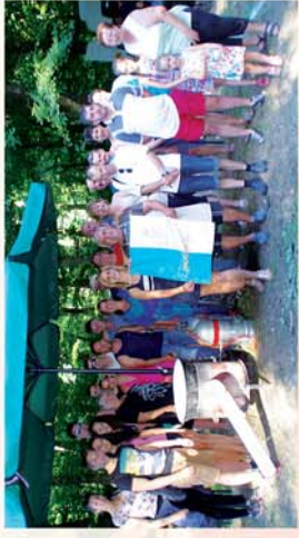
■ Főzőverseny a Szajki-tavaknál