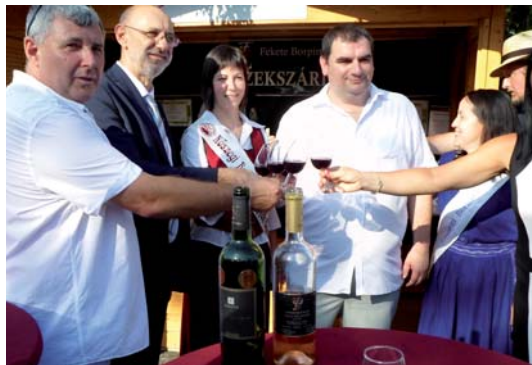
Az ELSŐ koccintás Bük város 2015. évi borával

tesek. Minden napnak megvolt a nagy közönséget vonzó csapata, kezdve a világmárka Csík zenekarral és Lovasi Andrással, majd a Cimbaliband, mely még Bükki Himnusz is alkotta, folytatva a 2006-tól kezdve többször is fellépő Ocho Machon, Szabó Balázs Bandáján keresztül, végül a fergetegesen záró Quimbyig. Persze az elő- és buli zenekarok is kitétek magukért, és hozzájárultak a jó hangulat kialakításá-