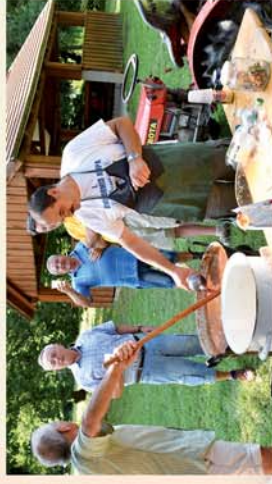
■ Tömördi falunapon jártunk