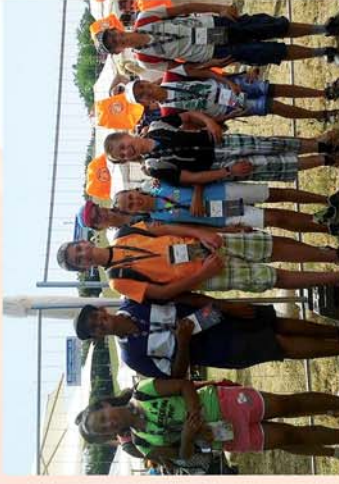
■ Csepregi gyermekek a Hungaroringen