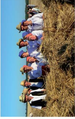
■ 25 éve a búzakarászok között