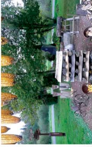
■ „Itt van az ősz, itt van újra...”

Naponta friss hírek a www.repcevidek.hu weboldalon!