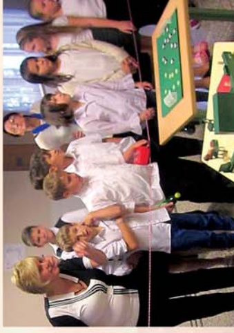
■ Így emlékeztünk mi