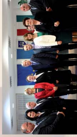
■ Önkormányzati alakuló ülés Csepregen