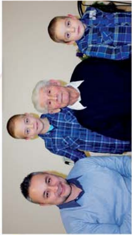
■ 95. születésnapot ünnepeltek 10. oldal