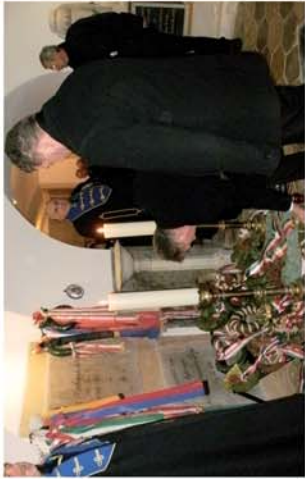
■ A „legnagyobb magyarra” emlékeztek 7. oldal