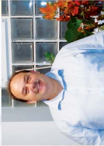
■ Zsira egy esztendeje 10. oldal