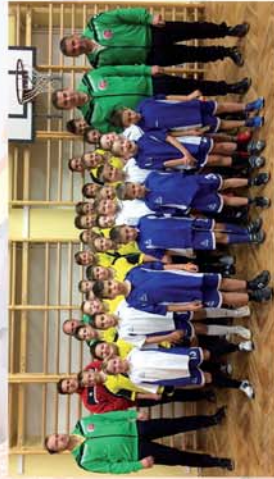
■ Évzáró foci Sopronhorpácson 15. oldal