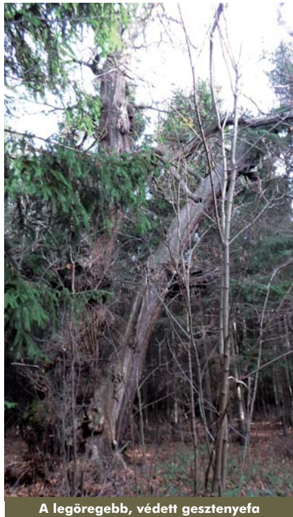
A legöregebb, védett gesztenyefa

A szokatlanul csapadékos múlt évben többször arról olvashattunk, hogy lehetőleg hagyjuk el az erdei sétákat, mert a felázott talajban könnyen és váratlanul kidőlhetnek fák. A Rámókon, a parkerdő felé menő erdei sétaúton a korábban rádől, elszáradt gesztenyefák közelében a múlt év elején fenyőfák is az útra borultak. Decemberig ott is maradtak, bosszaníva az arra járókat és lovaglókát, akik kerülővel, de tovább mentek. Év vége felé aztán egy kivételével – ez még ma is ott van a mélyedés alján az