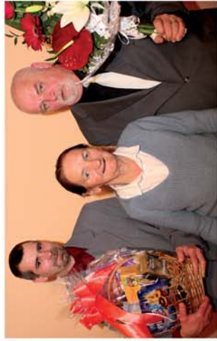
■ Szépkorú köszöntése Tormásligeten 2. oldal

Naponta friss hírek a www.repcevidek.hu weboldalon!