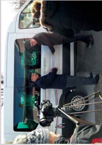
■ Új közösségi busz Iklanberényben 12. oldal