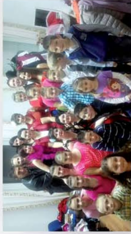
■ Tompaládonyi tavaszváró 6. oldal