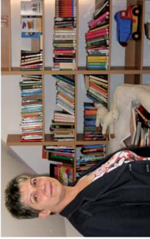
■ Zajlik az élet Góron

Naponta friss hírek a www.repcevidek.hu weboldalon!