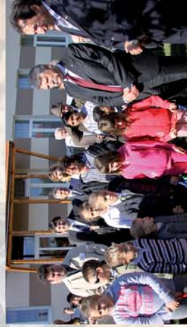
■ Simaság 750 éves