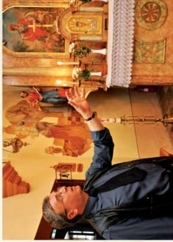
■ Szent Márton évére készült Ólomodon