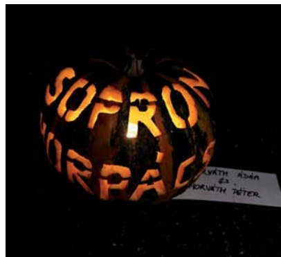
További képek a www.repcevidék.hu weblapon!

A zsűri pontszámai és a közönség-szavazatok összefésülése után-nem meglepő módon – a rétesek készítője /tökös-túrós-almás és mákos/ vitte el az első díjat.