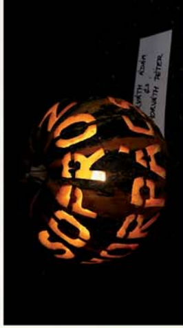
■ Tökös nap volt Sopronhorpácson